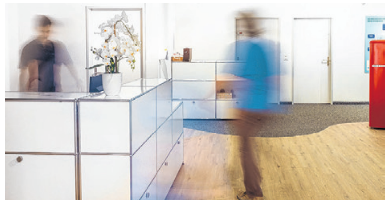
Spitex-Alltag im Fluss.