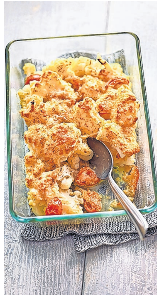
Ruck, zuck fertig: mit einer Parmesan-Mandel-Paste überbackener Blumenkohl.

Blumenkohl in die vorbereitete Form geben und die Tomatenstücke dazwischen verteilen. Die Folie von der Paste abziehen und die Blumenkohlmischung damit bedecken. Im vorgeheizten Ofen auf der oberen Schiene vier bis fünf Minuten goldbraun überbacken – fertig!