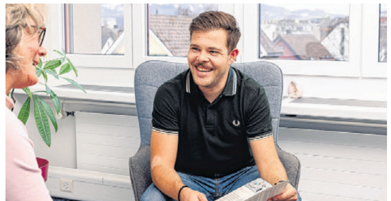
Bereichsleitung im fachlichen Austausch.

Wir bieten Ihnen 24h-Sicherheit mit unserem Spitex-Notruf.