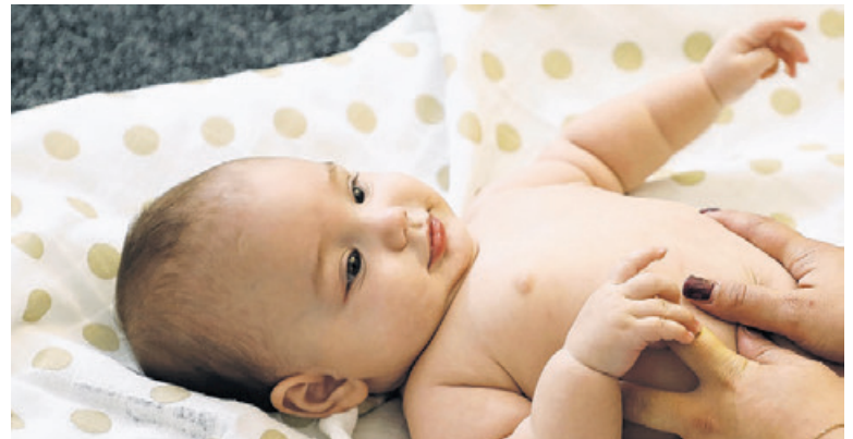
Unsere Fachberatung Frühe Kindheit.